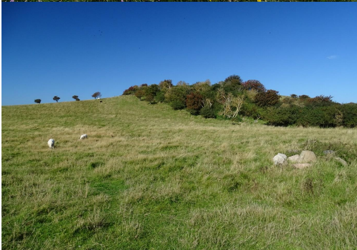
Begge billeder af overdrev på Fyns Hoved. Stor forskel på artsdiversiteten på arealer der afgræsses med kreaturer (øverste billede), og arealer der afgræsses med får (nederste billede).