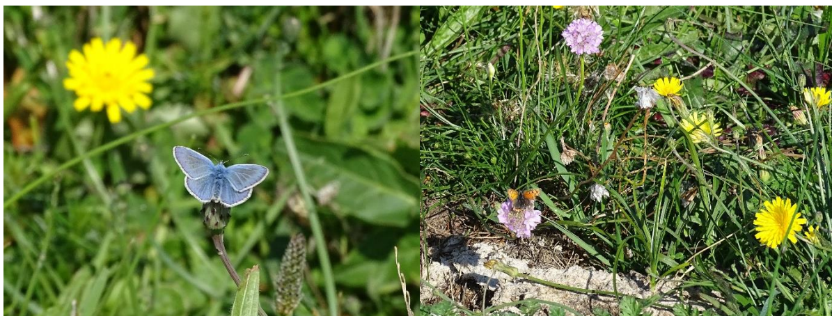
Almindelig blåfugl ( Polyommatus icarus ) og lille ildfugl ( Lycaena phlaeas ) ved overdrevsarealer på Fyns Hoved, med store bestande af håret høgeurt ( Pilosella officinarum ) og engelskgræs ( Armeria maritima ).

For samtlige Natura 2000-planer er der foretaget en strategisk miljøvurdering (SMV). Natura 2000-planerne og de tilhørende miljøvurderinger kan findes på Miljøstyrelsens hjemmeside under Natura 2000, tredje generation planer (2022-2027).